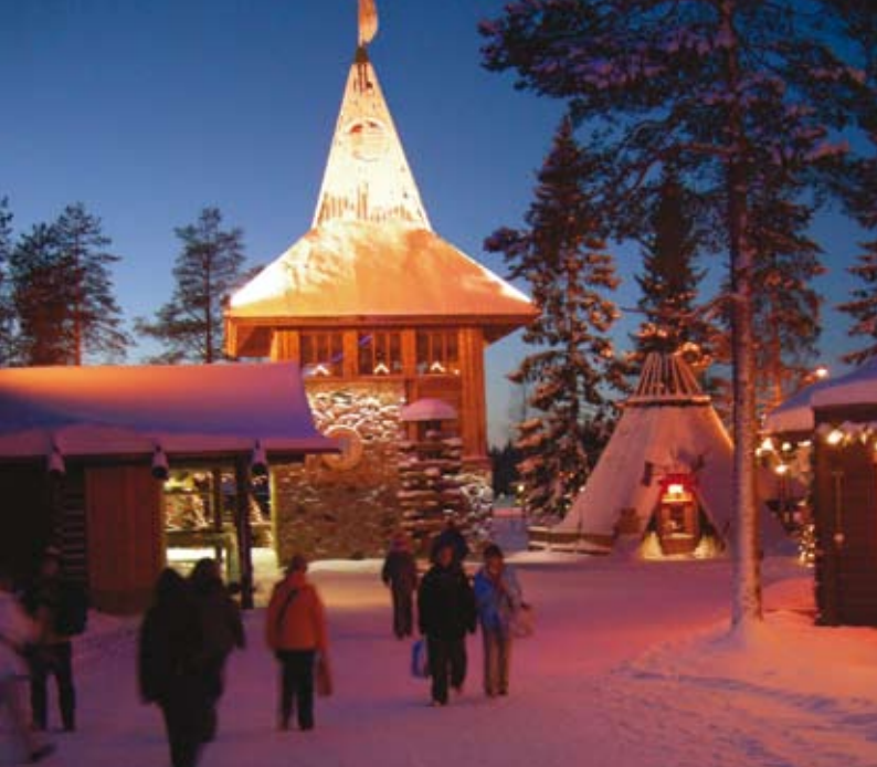
Le village du Père Noël