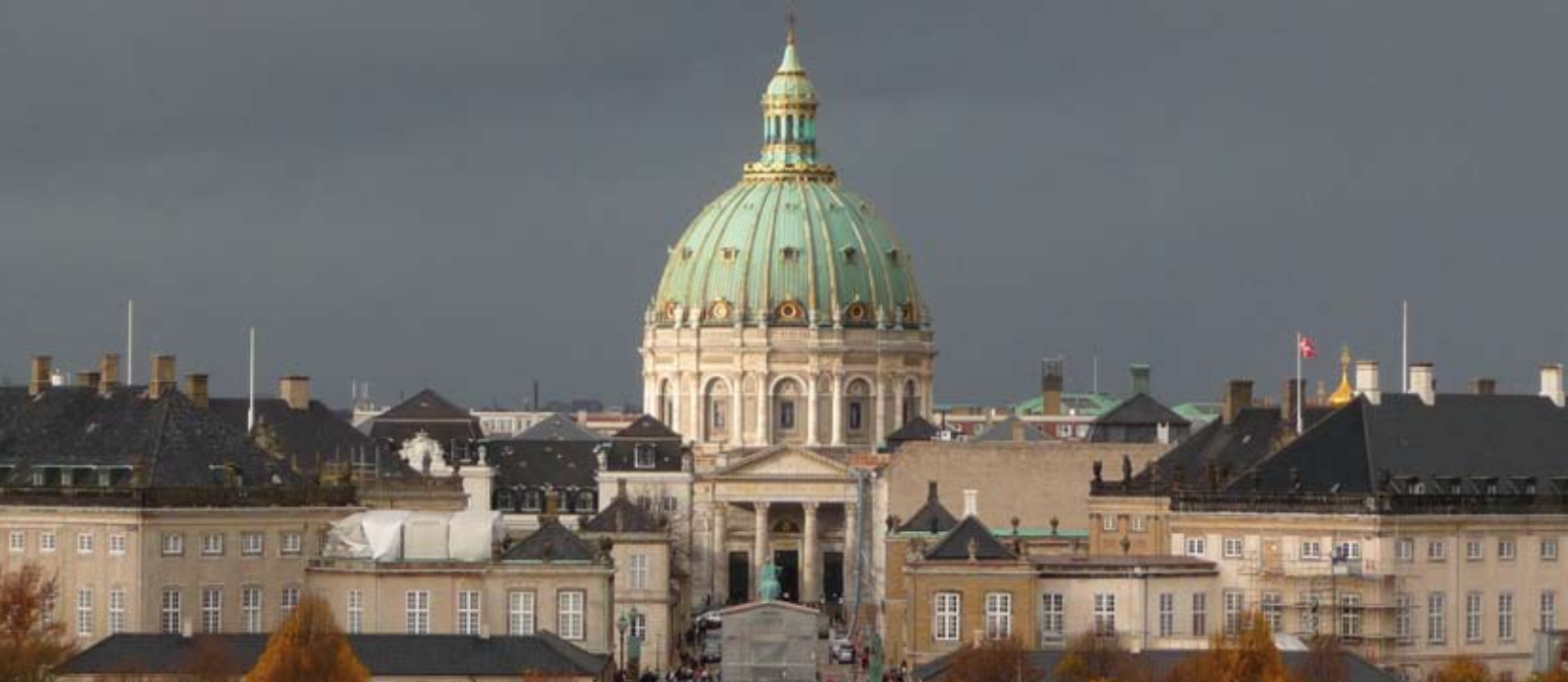
Le château Amalienborg