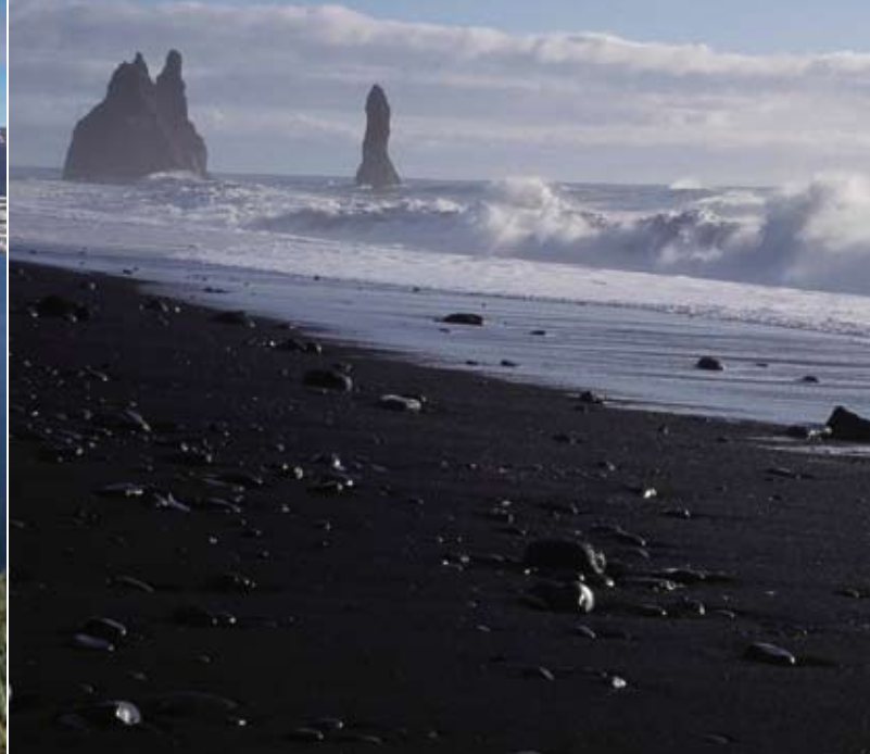
Contrastes du sud: les plages de lave et un paysage printanier