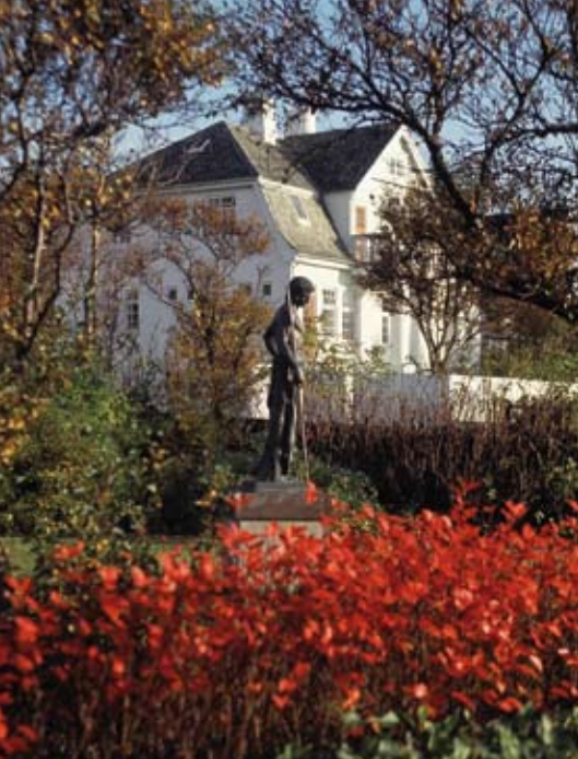
Reykjavik, petite capitale nordique