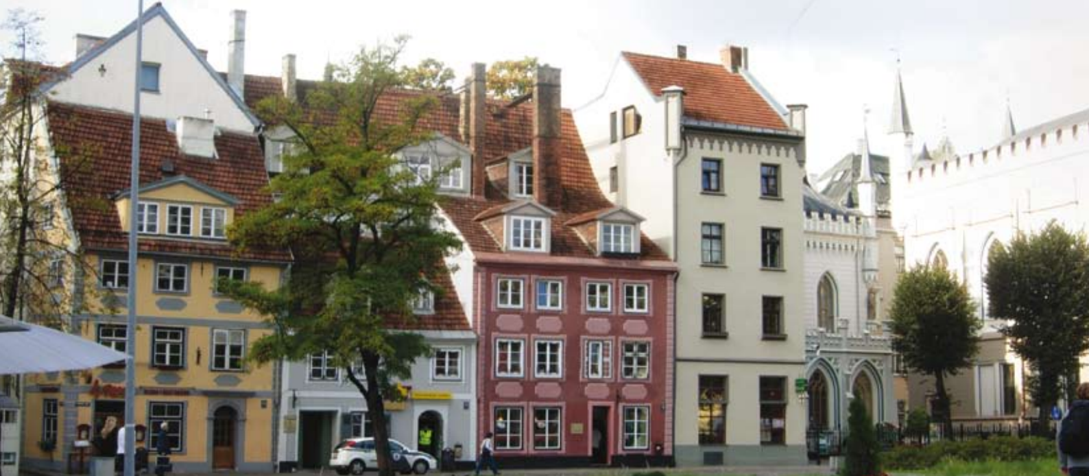
La vieille ville de Riga