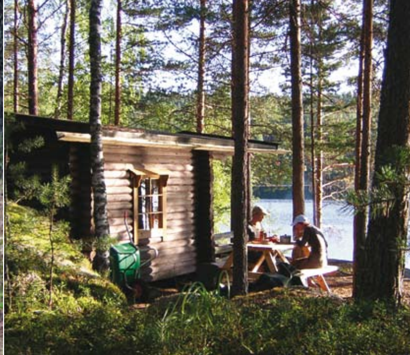
Chalet en rondins à Laajalahti