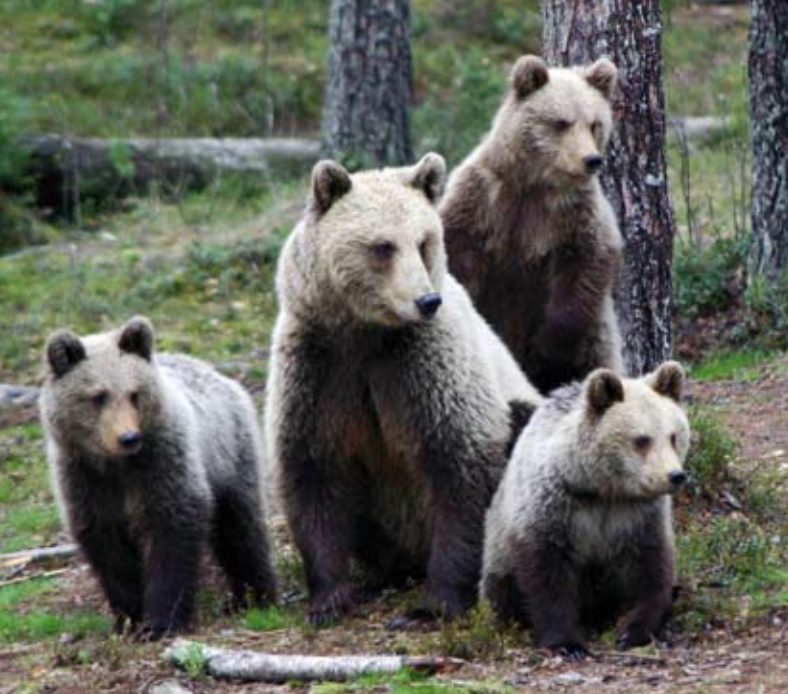
Une famille d'ours à Juntusranta