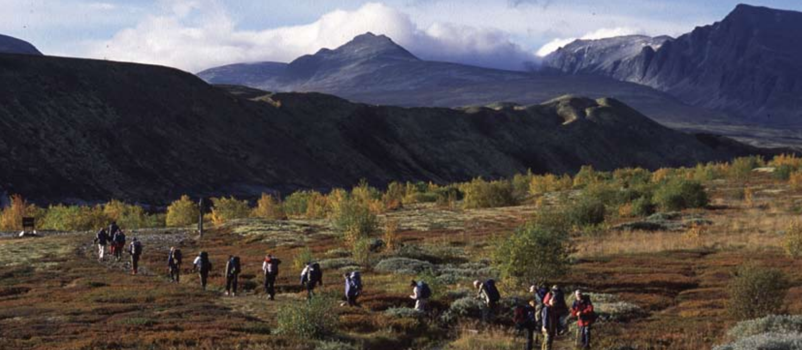
Le parc national Rondane