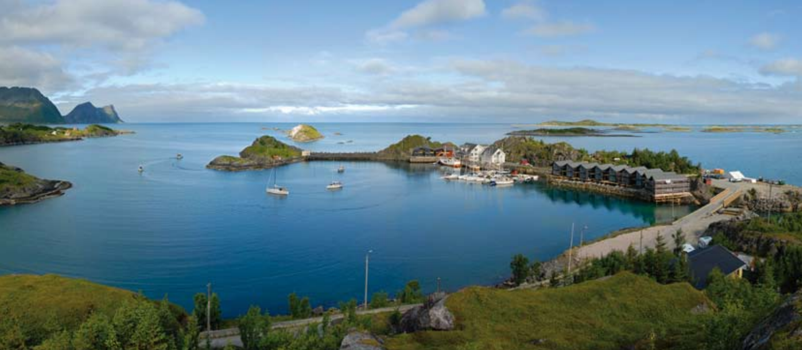
Ile de Senja