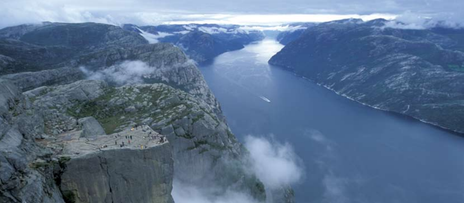
Vue sur le fjord