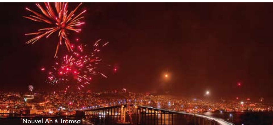
Nouvel An à Tromsø

Accueillez l'an 2011 au milieu de la nature hivernale et enneigée de Norvège. Programme du Nouvel An avec repas du soir festif, musique et danse à bord.