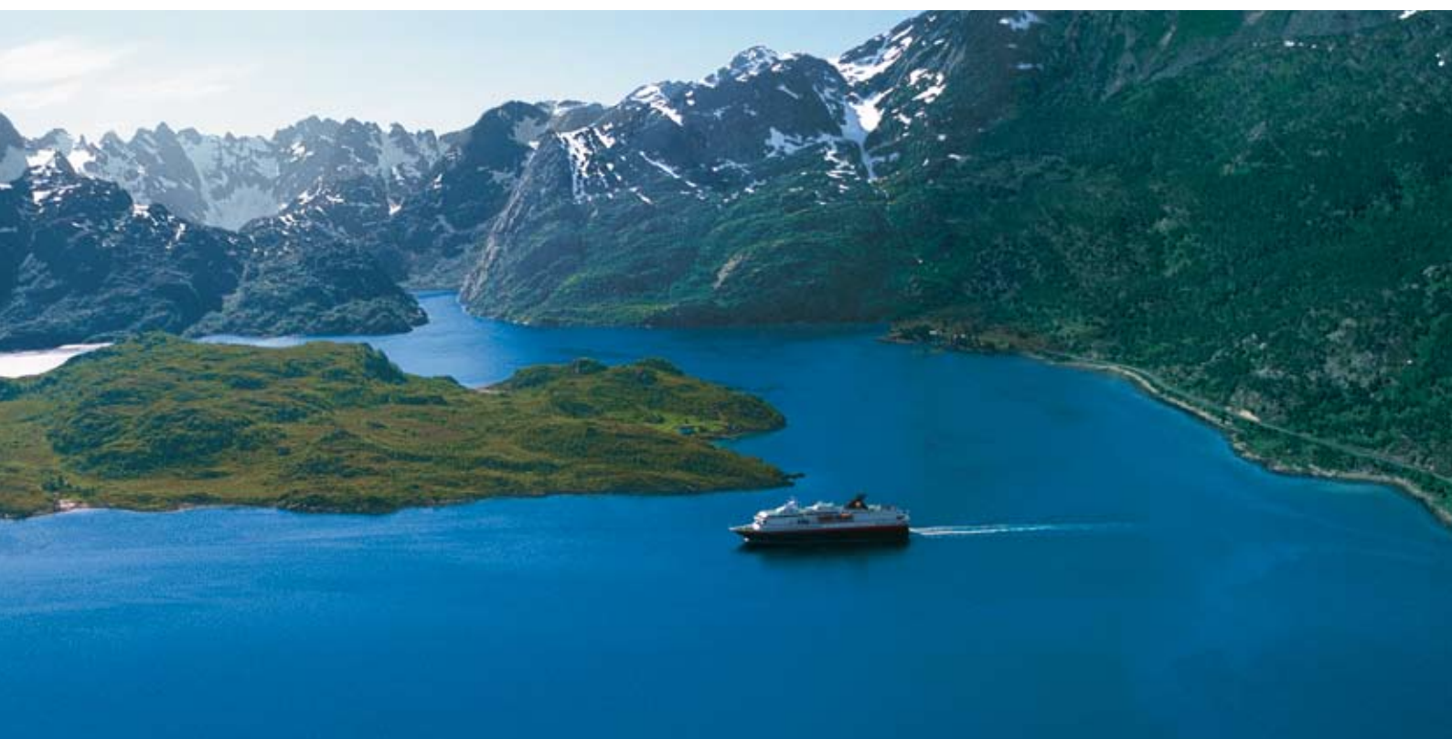
Les paysages fascinants le long de la côte norvégienne

Ce voyage vous permet de combiner une croisière à bord du Hurtigruten le long de la côte norvégienne avec un séjour dans de magnifiques paysages d'îles, les Lofoten et les Vesterålen. La ville royale de Trondheim, le Cap Nord et Kirkenes, la plaque tournante située près de la frontière russe, sont les autres points culminants de ce trajet en direction du Nord; Hammerfest, la ville la plus ancienne de Norvège, est l'une des curiosités touristiques sur le trajet en direction du Sud.