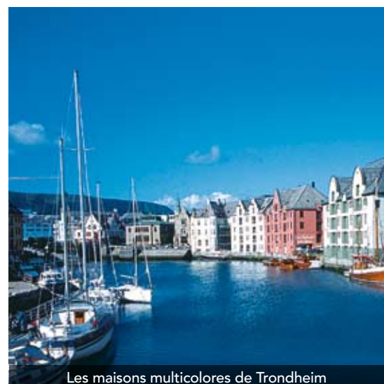
Les maisons multicolores de Trondheim