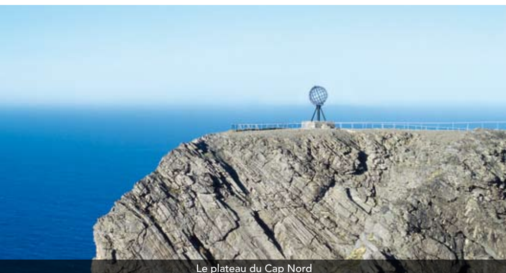
Le plateau du Cap Nord