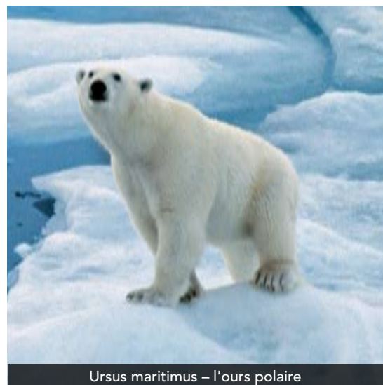
Ursus maritimus – l'ours polaire