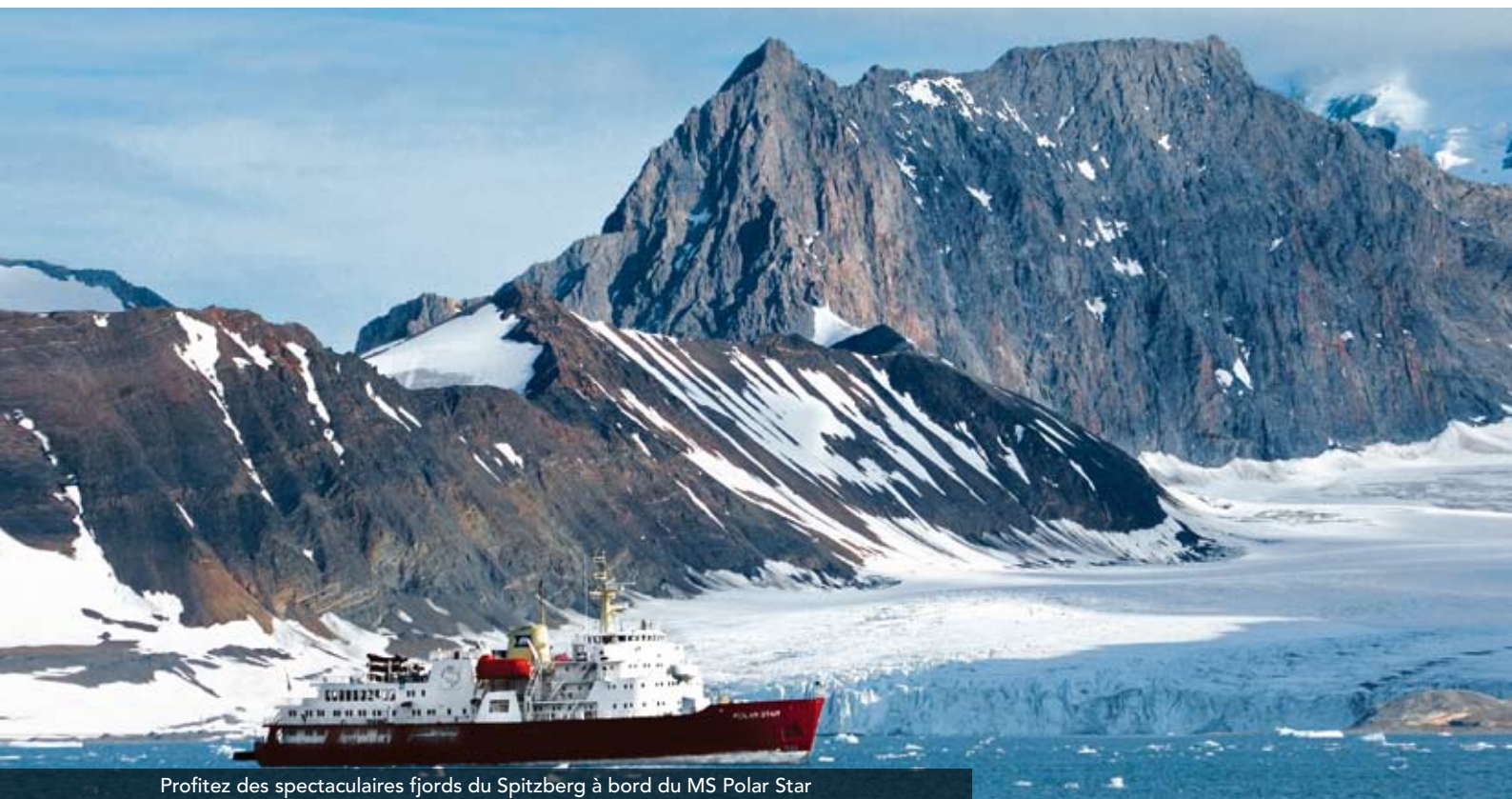
Profitez des spectaculaires fjords du Spitzberg à bord du MS Polar Star

La nature intacte de l'archipel du Svalbard exerce sur le visiteur un magnétisme d'une étrange intensité que vous ne manquerez pas de ressentir au plus profond de vous-même tout au long de ce voyage. Vous découvrirez le scintillement bleu cristallin des glaciers baignés dans l'intense lumière du soleil de minuit et traverserez en notre compagnie le fascinant monde des fjords et de leurs étranges sculptures de glace. L'immersion complète au pays des ours blancs, baleines, phoques et renards polaires vous est garantie!