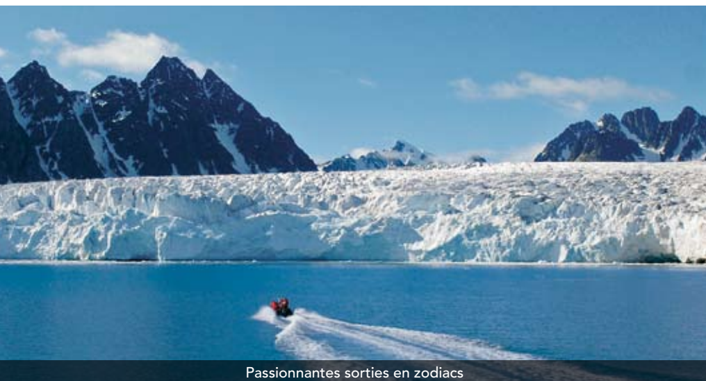
Passionnantes sorties en zodiacs