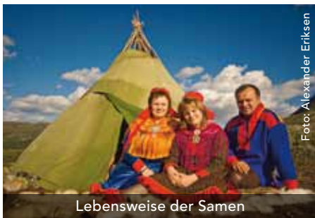
Lebensweise der Samen