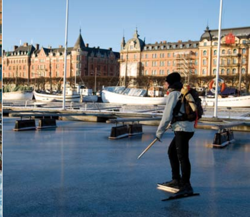
Winterliche Strasse und Strandvägen in Stockholm