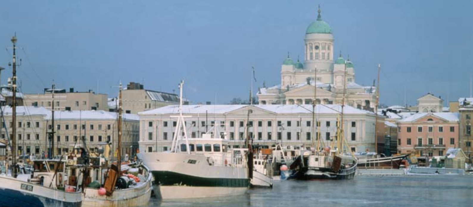
Winterstimmung in Helsinki