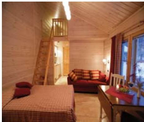
Ounasvaaran Pirtit, Haus für zwei Personen (rotes Haus)

Schöne, moderne, geräumige Ferienhäuser (Doppelhäuser), 67 m 2 , Stube mit Cheminée, Küche, 2 Schlafzimmer, Schlafgalerie und Sauna. GWM, Waschmaschine.