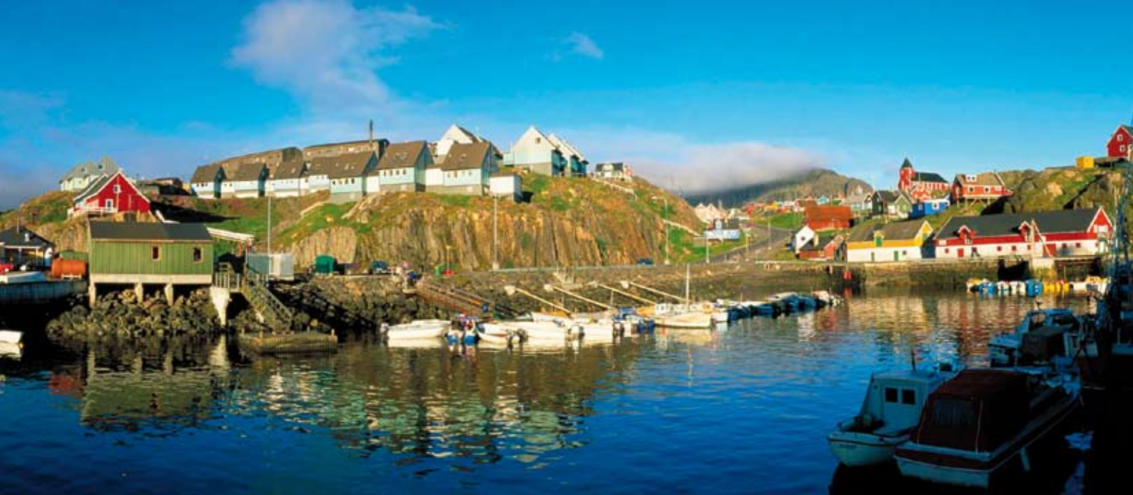
Hafen von Sisimiut