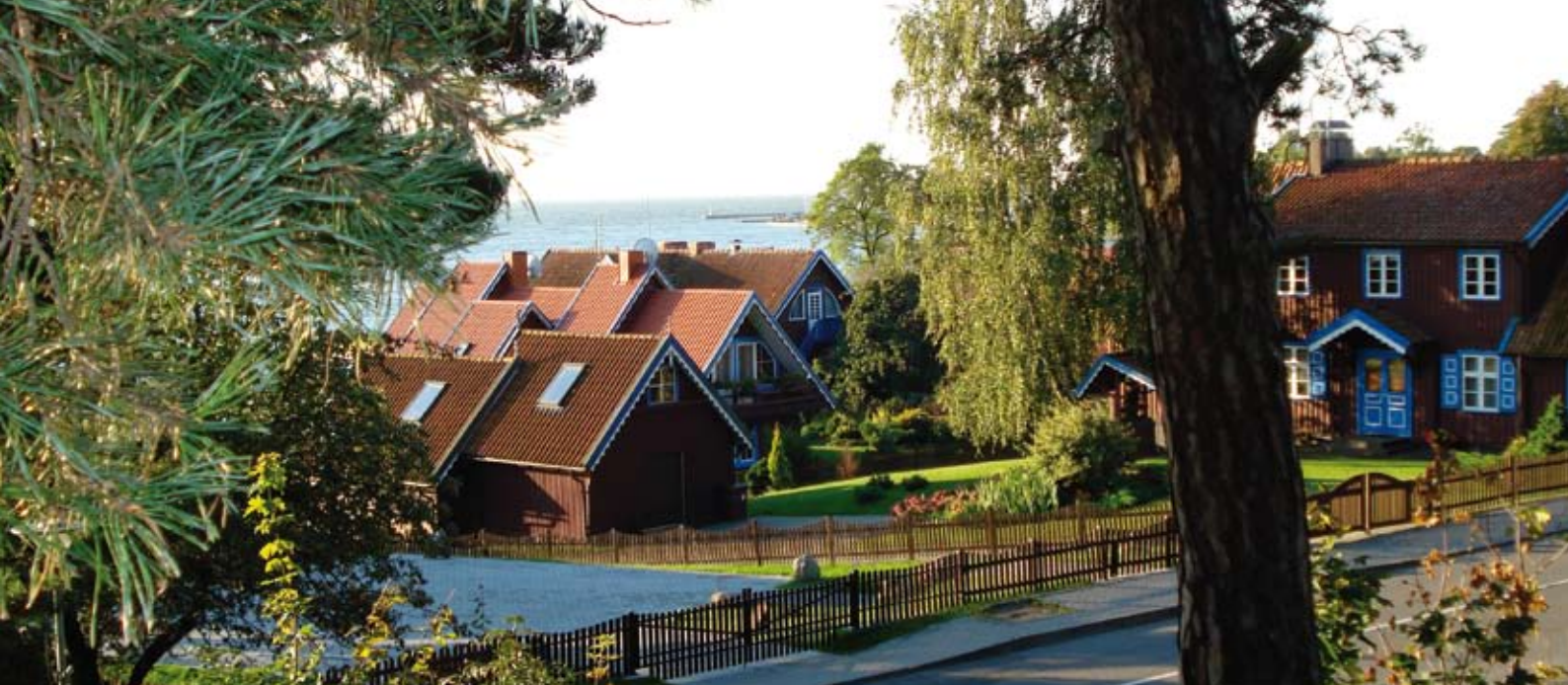
Kurische Nehrung, Nida