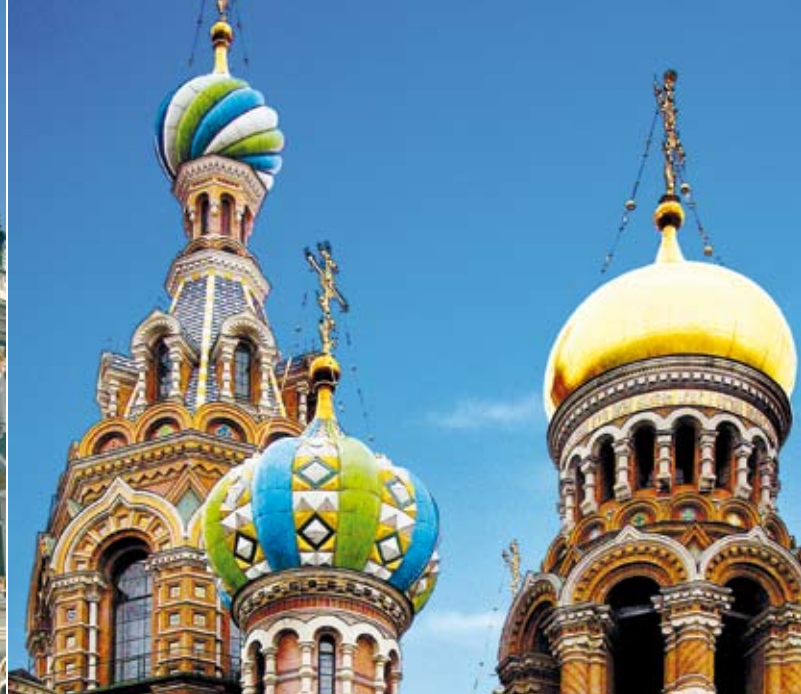
Winterpalast Ermitage & Erlöserkirche (Blutkirche)