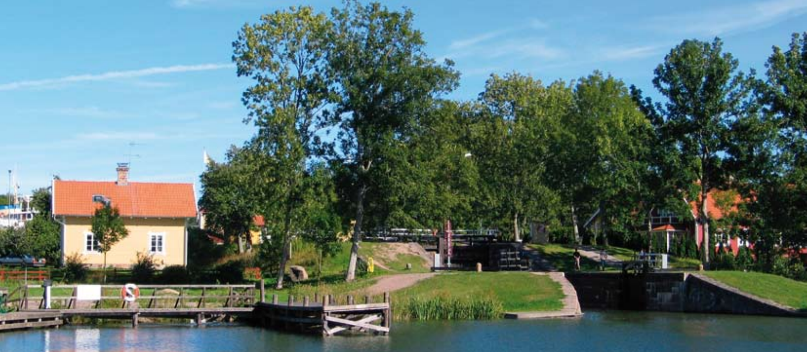
Schleuseneinfahrt Göta Kanal