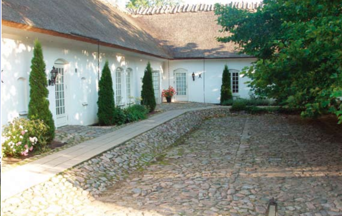
Countryside Hotel Karlaby Kro und alte Mühle auf Öland