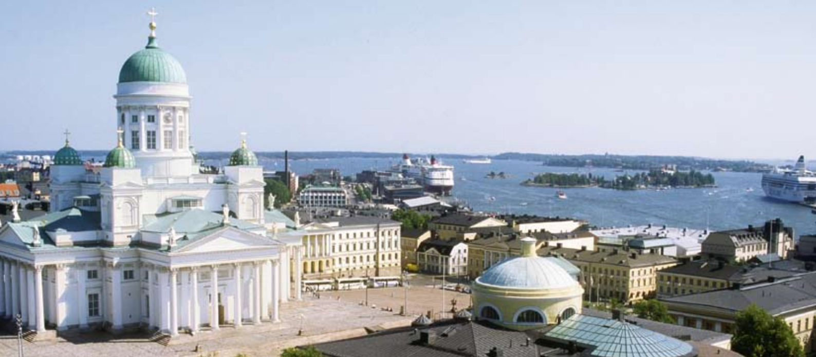
Der Dom von Helsinki