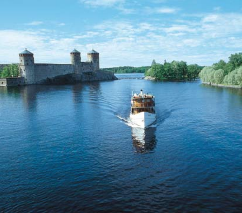
Seenlandschaft bei Savonlinna & Lofoten