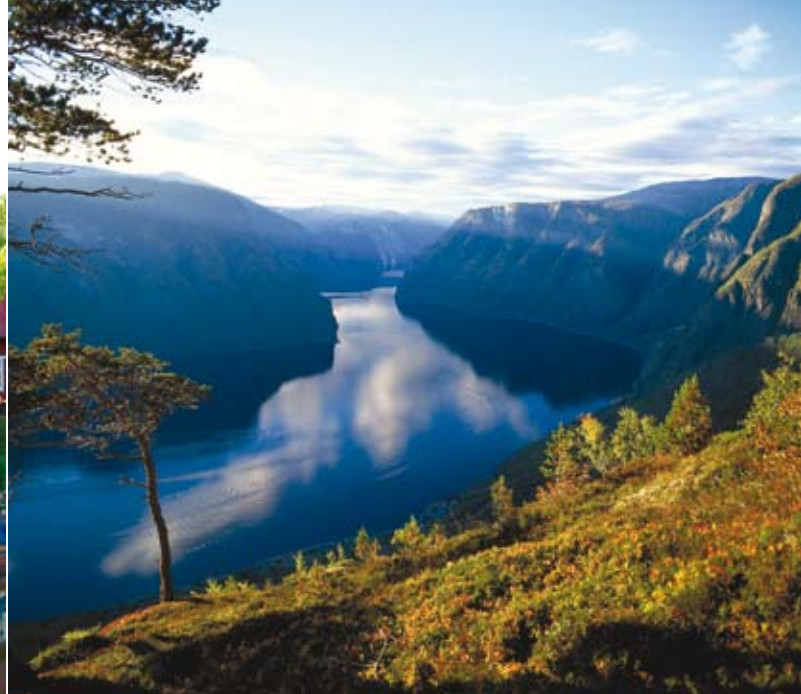
Am Götakanal / Fjordlandschaft