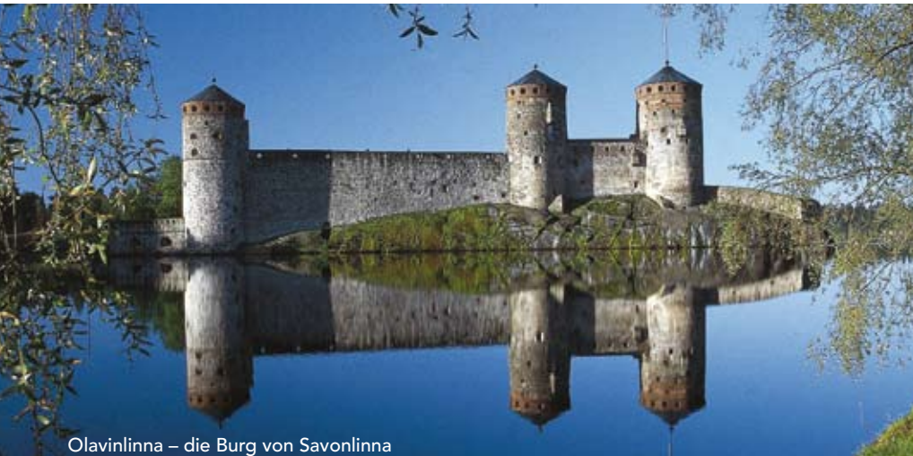
Olavinlinna – die Burg von Savonlinna