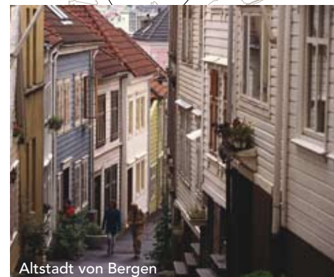
Altstadt von Bergen