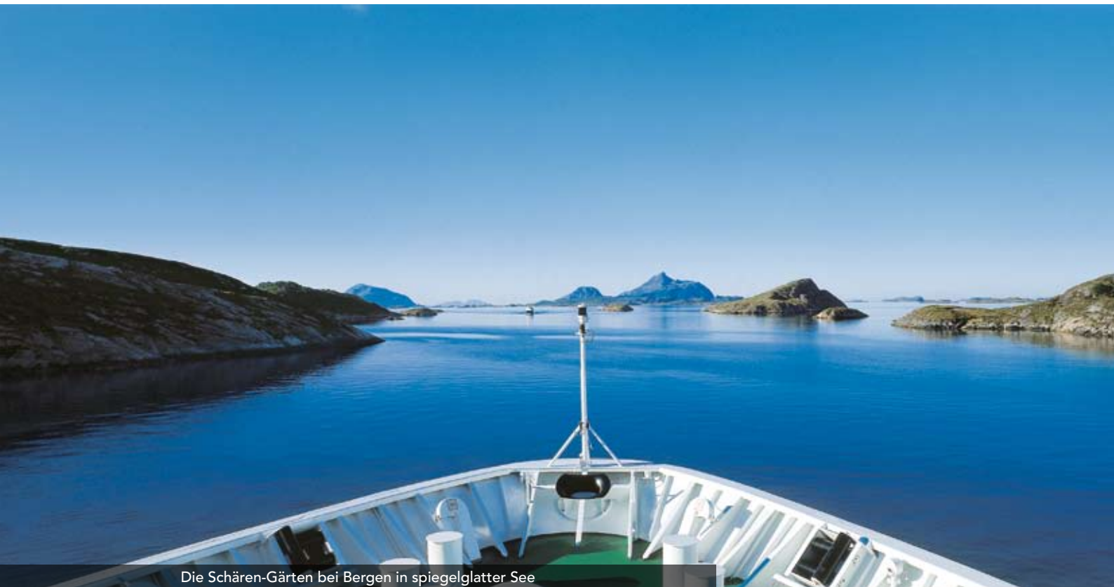
Die Schären-Gärten bei Bergen in spiegelglatter See

Erst geht es zu den spektakulären Berglandschaften jenseits des Polarkreises, dann zurück in die gemässigten Breitengrade. Auf Ihrer 11-Tage-Reise sehen Sie die norwegische Fjordküste in ihrer ganzen Schönheit und erleben viele gemütliche und zugleich betriebsame Anlandungen in kleinen und grösseren Hafenorten. Auf der nordgehenden Route erwarten Sie unter anderem die Jugendstilstadt Ålesund und die Krönungsstadt Trondheim, die für ihre einmalige Architektur und viele Kulturhöhepunkte bekannt ist. Südgehend zeigen sich die idyllischen Inselgruppen Vesterålen und Lofoten in ihrer vollen Pracht.