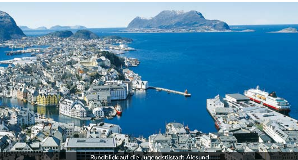
Rundblick auf die Jugendstilstadt Ålesund