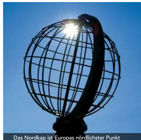
Das Nordkap ist Europas nördlichster Punkt